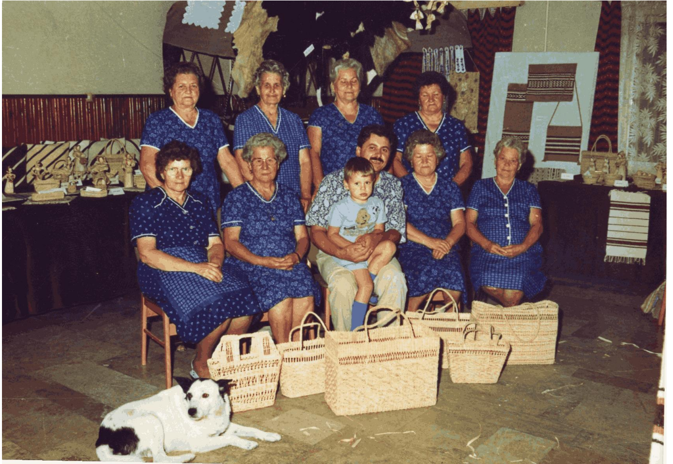
1994-ben rendezett kiállítás a Lukácsi Máté Művelődési házban